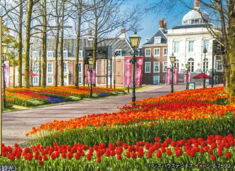
(ハウステンボス イメージ B-7599)