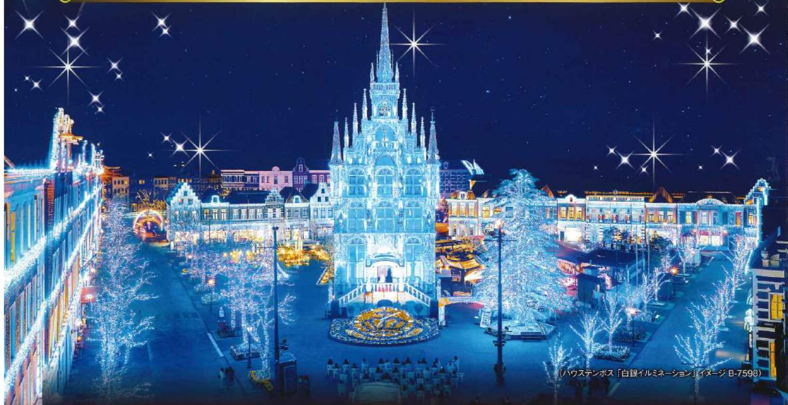
(ハウステンボス「白銀イルミネーション」イメージ B-7598)