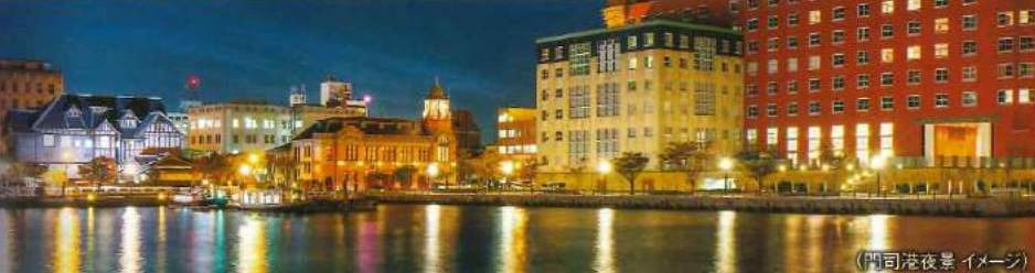
(門司港夜景 イメージ)

—— 航空機、新幹線、電車、モノレールなど —— バス、タクシーなど … 徒歩 ※行程中の時間は予定時間(目安)です。(●入場又は乗船観光 ◎下車観光 ○車窓観光)