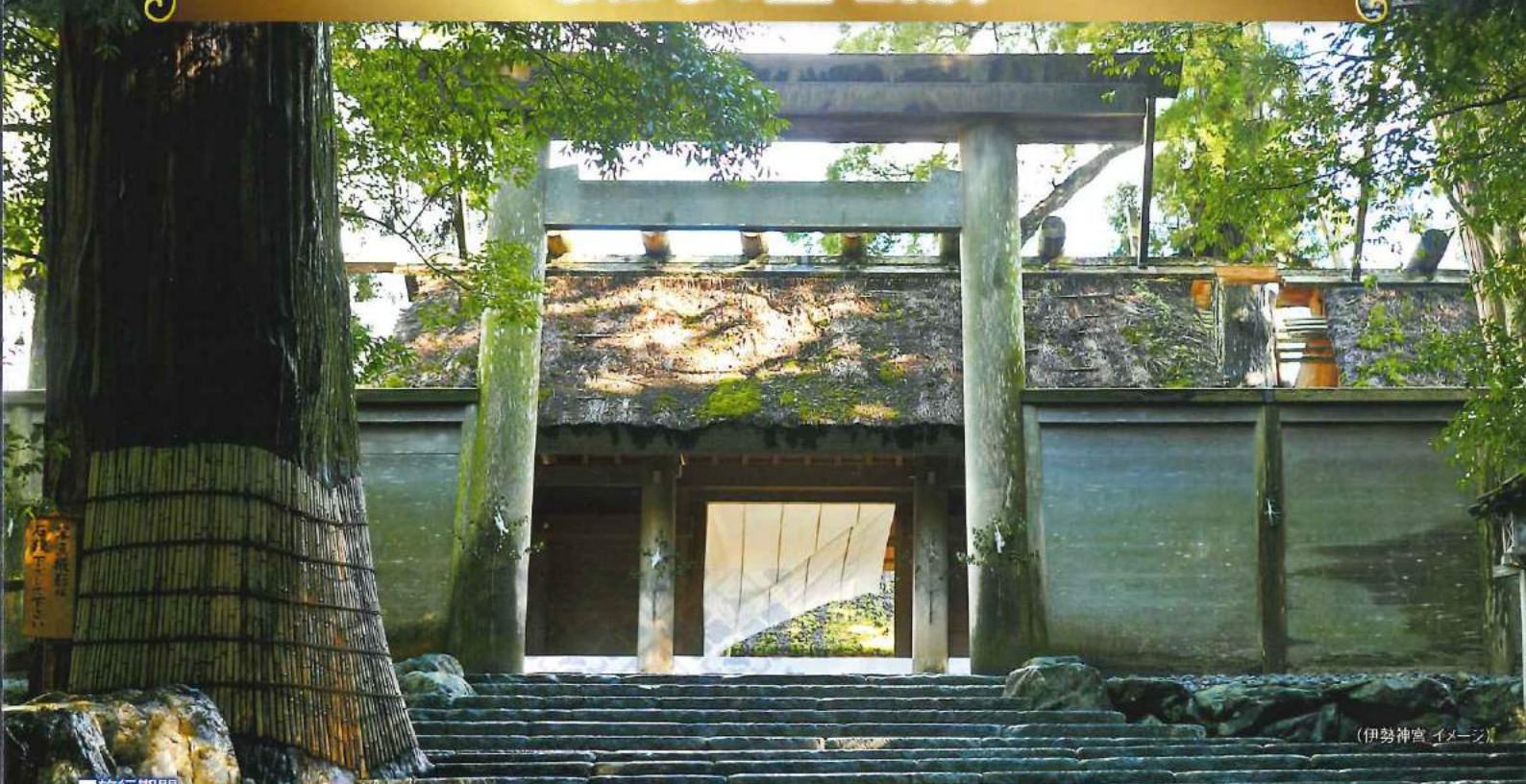
(伊勢神宮 イメージ)