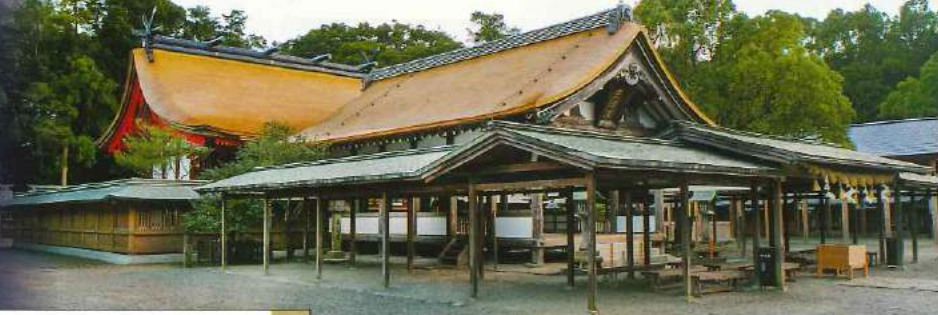
(福岡県観光連盟提供 宗像大社 イメージ)

—— 航空機、新幹線、電車、モノレールなど —— バス、タクシーなど … 徒歩 ※行程中の時間は予定時間(目安)です。(●入場又は乗船観光 ◎下車観光 ○車窓観光)