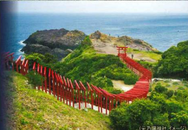
(元乃隈神社 イメージ)