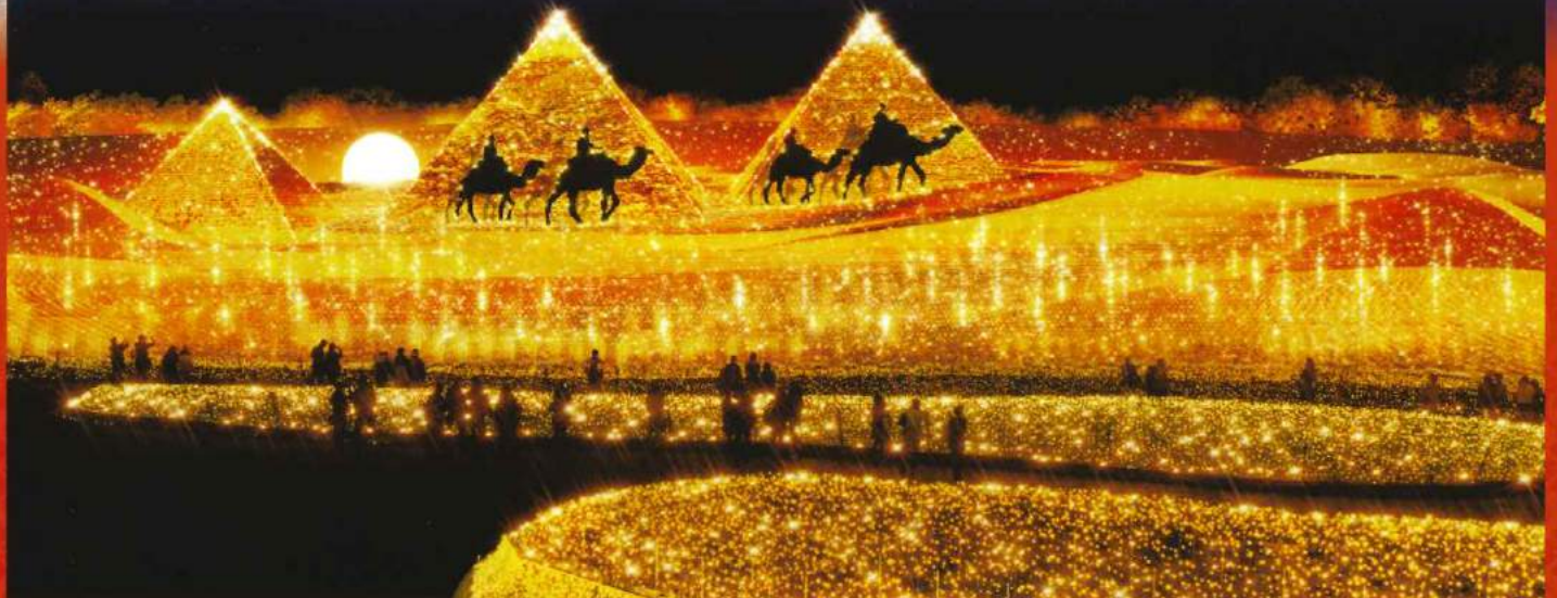
(なばなの里「黄金のピラミッド」イメージ)