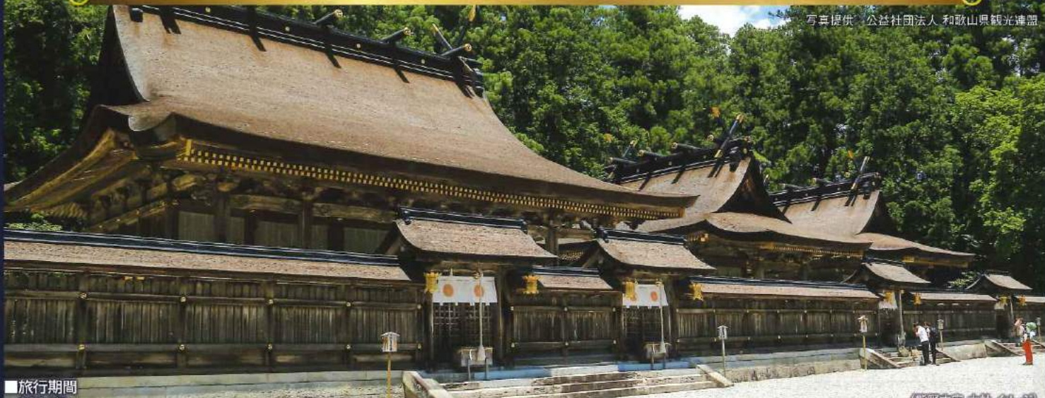
熊野本宮 大社(イメージ)